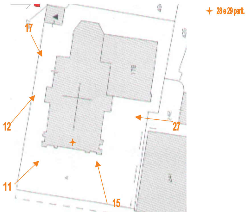
Punti di ripresa fotografica